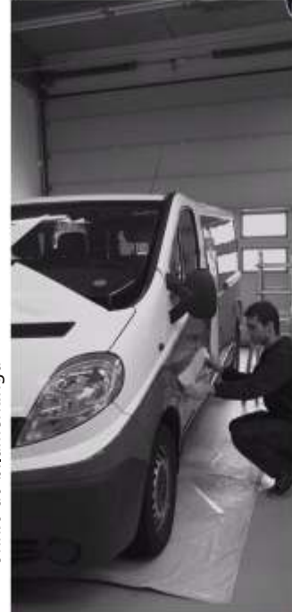
Unnið að bílamerkingu