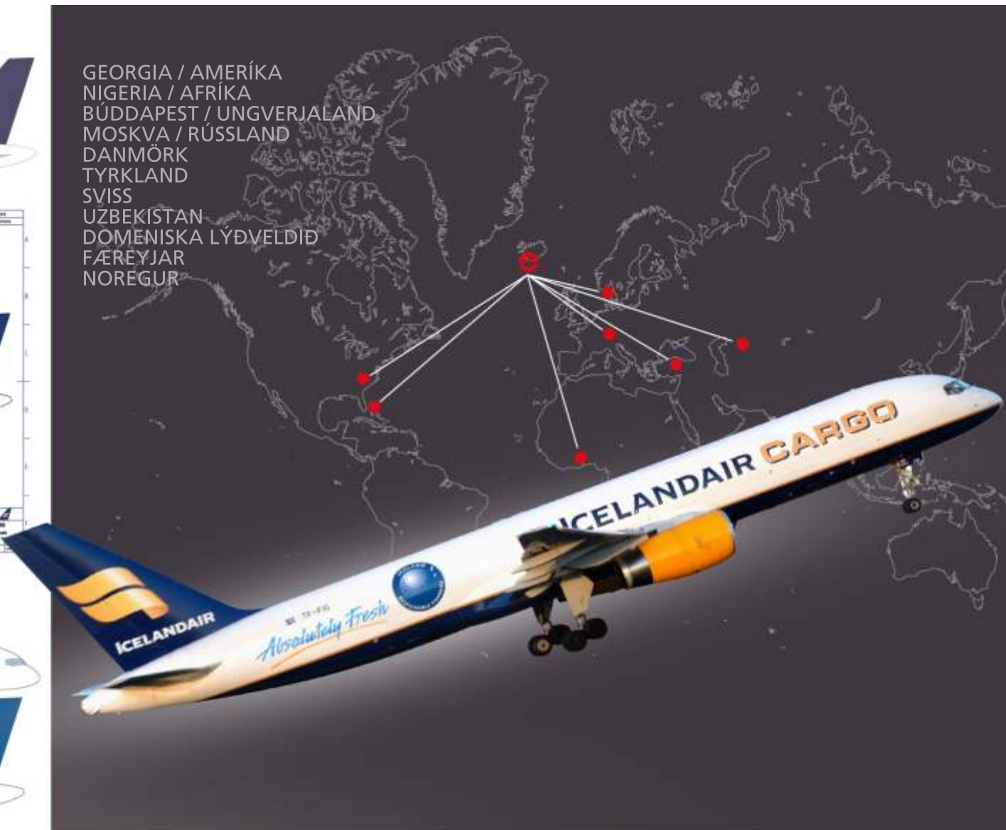
Merking hefur merkt flugvélar um allan heim

GEORGIA / AMERÍKA NIGERIA / AFRÍKA BÚDDAPEST / UNGVERJALAND MOSKVA / RÚSSLAND DANMÖRK TYRKLAND SVISS UZBEKÍSTAN DOMENISKA LÝÐVELDIÐ FÆREYJAR NOREGUR