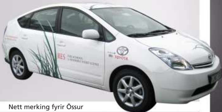
Nett merking fyrir Össur