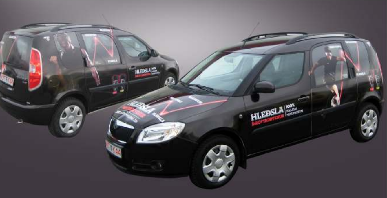
Heilmerktur bíll fyrir MS